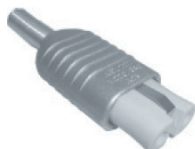
Connecteur aluminium droit 25 A