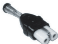
Connecteur bakélite droit 10 A