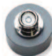
NIVEAU POUR CAPTEURS DE LUMIÈRE M-LLA

Utilisé pour installer 2 capteurs PAR et 2 capteurs de radiation solaire pour réaliser des mesures NDVI