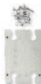
SUPPORT NDVI POUR CAPTEUR DE LUMIÈRE M-NDVI

Utilisé pour installer 2 capteurs PAR et 2 capteurs de radiation solaire pour réaliser des mesures NDVI