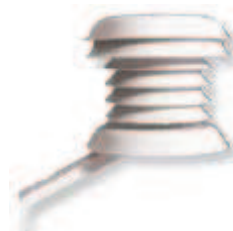
ABRI ANTIRADIATION SOLAIRE RS3 Pour sondes S-TMB et S-THB