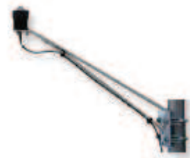
BRAS POUR CAPTEUR DE LUMIÈRE M-LBB